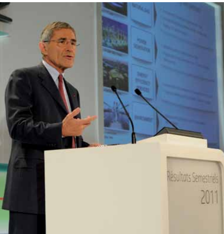
Gérard Mestrallet lors de la présentation des résultats semestriels 2011