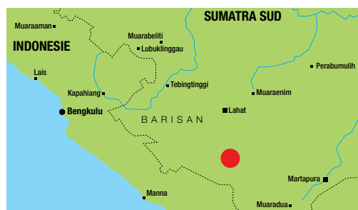
Rantau Dedap en Indonésie

GDF SUEZ intervient déjà activement en Indonésie dans les domaines de l'électricité, du pétrole et du gaz, et des services liés à l'eau. Le Groupe y est le premier producteur indépendant avec 1280 MW d'actifs en exploitation et 850 MW en cours de construction (centrale de Paiton).