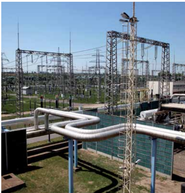
Centrale à cycle combiné de Dunamenti