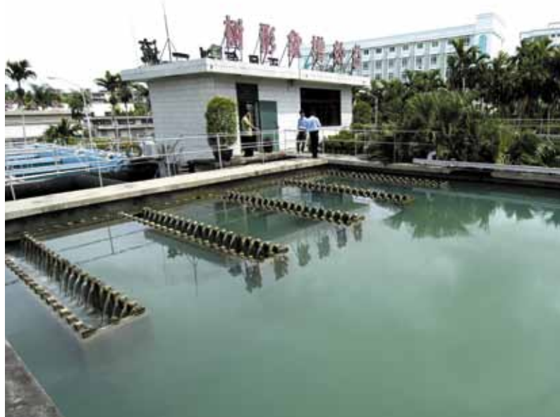
Usine de traitement d'eau potable, Macao (Chine)

Le partenariat signé avec GDF SUEZ figure parmi les plus gros accords que le CIC ait noués. C'est par ailleurs la 1 ère fois que le fonds souverain chinois signe un accord global de ce type, qui intègre à la fois un partenariat sur des investissements communs, une coopération financière et un parrainage commercial en Asie et notamment en Chine.